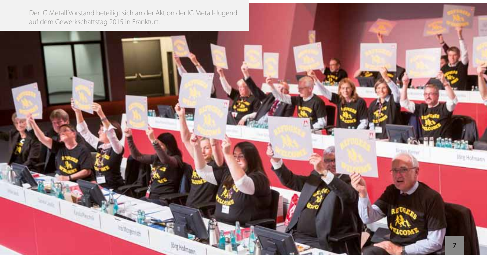
Der IG Metall Vorstand beteiligt sich an der Aktion der IG Metall-Jugend auf dem Gewerkschaftstag 2015 in Frankfurt.