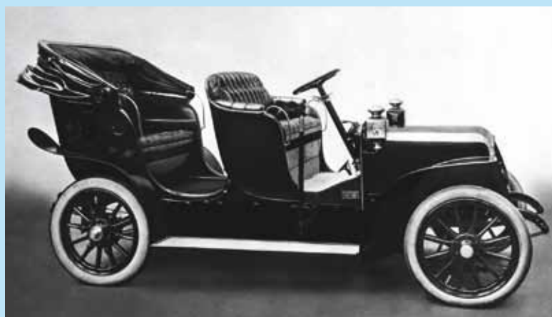
E-Mobilität anno 1905: Die „Elektrische Viktoria“ der Firma Siemens