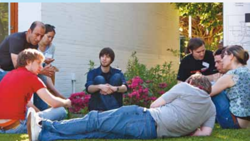
Foto: Studierendenseminar 2010

Viele junge Frauen und Männer werden während ihres Studiums Eltern.