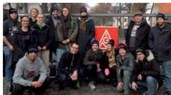
Die Studigruppe beim Klausurtreffen in Berlin Pichelsee.

Darüber hinaus finden auch Kooperationen mit anderen Hochschulgruppen statt. So wurde gemeinsam mit der Hamburger Gruppe „Blue Engineering“ im vergangenen Jahr der Film „Work Hard – Play