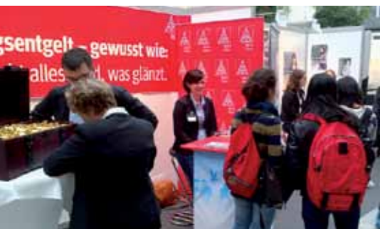
„Stellenwerk Jobmesse“ an der Uni Hamburg: „Einstiegsentgelt – es ist nicht alles Gold was glänzt!“

Kontakt über: e-mail mike.retz@igmetall.de